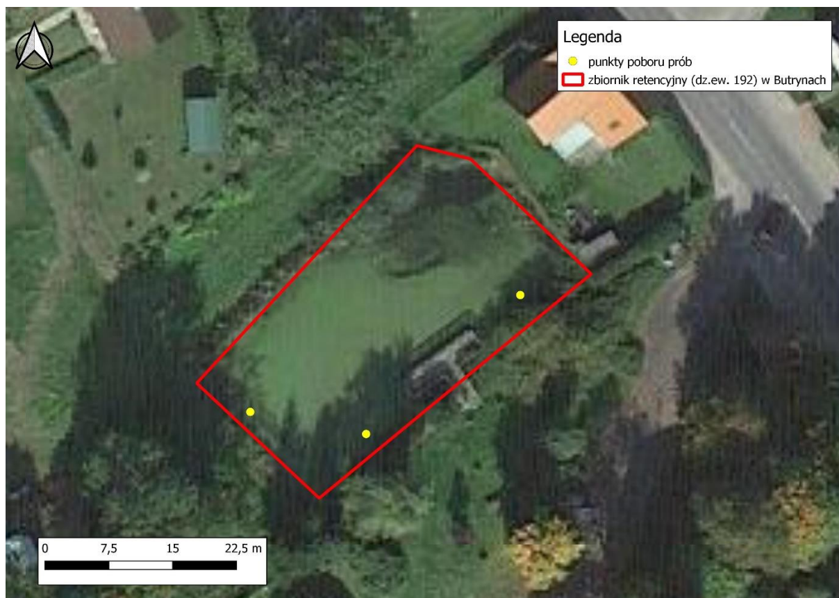
Ryc.2. Mapa lokalizacji punktów poboru prób w stawie.

Kontrola polegała na przeszukaniu obszaru stawu i najbliższego otoczenia pod kątem obecności osobników dorosłych. Staw obchodzono powoli wokół wypatrując osobników dorosłych płazów i gadów wygrzewających się na brzegach. Następnie użyto siatki hydrologicznej w celu wykonania prób hydrobiologicznych z dna stawu. Próby pobrano z 3 punktów (Ryc.2.). W każdym punkcie poboru prób wykonano 5 prób siatką hydrobiologiczną.