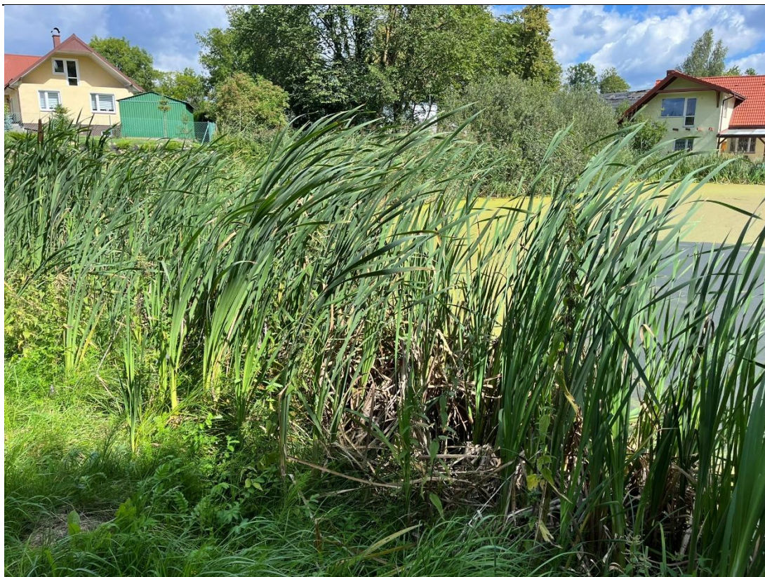
Fot.4. Szuwar pałkowy porastający obrzeża stawu.