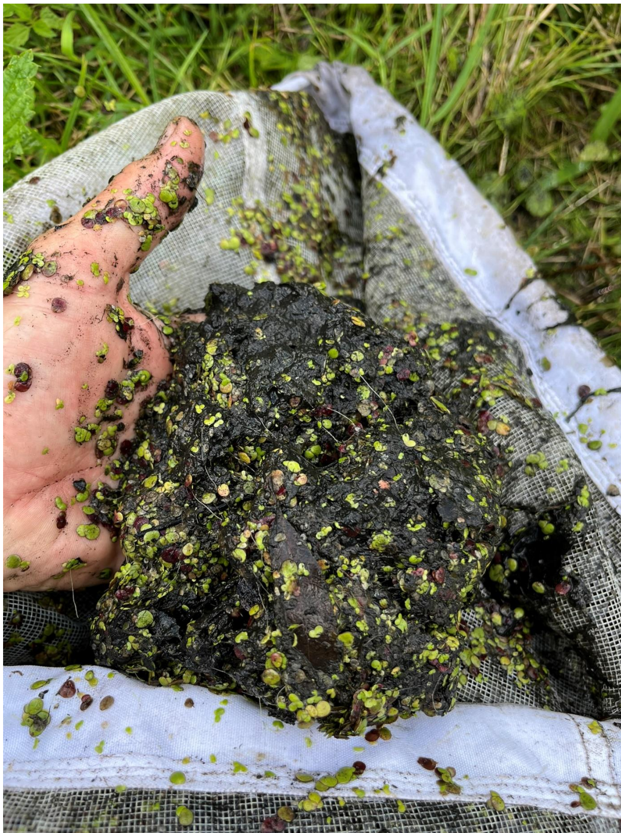
Fot.6. W każdej próbie hydrobiologicznej odnotowano duże ilości mułu o nieprzyjemnym zapachu, świadczącym o zachodzących procesach beztlenowych w zbiorniku.