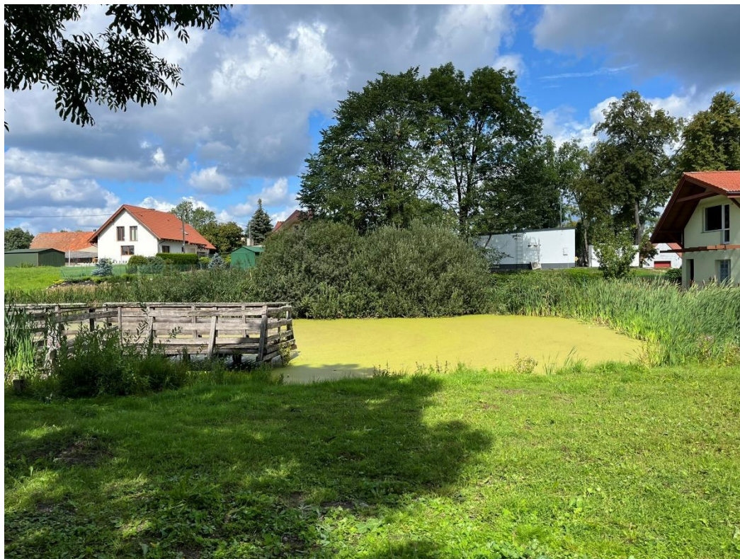
Fot.1. Zbiornik wodny będący obszarem badań.