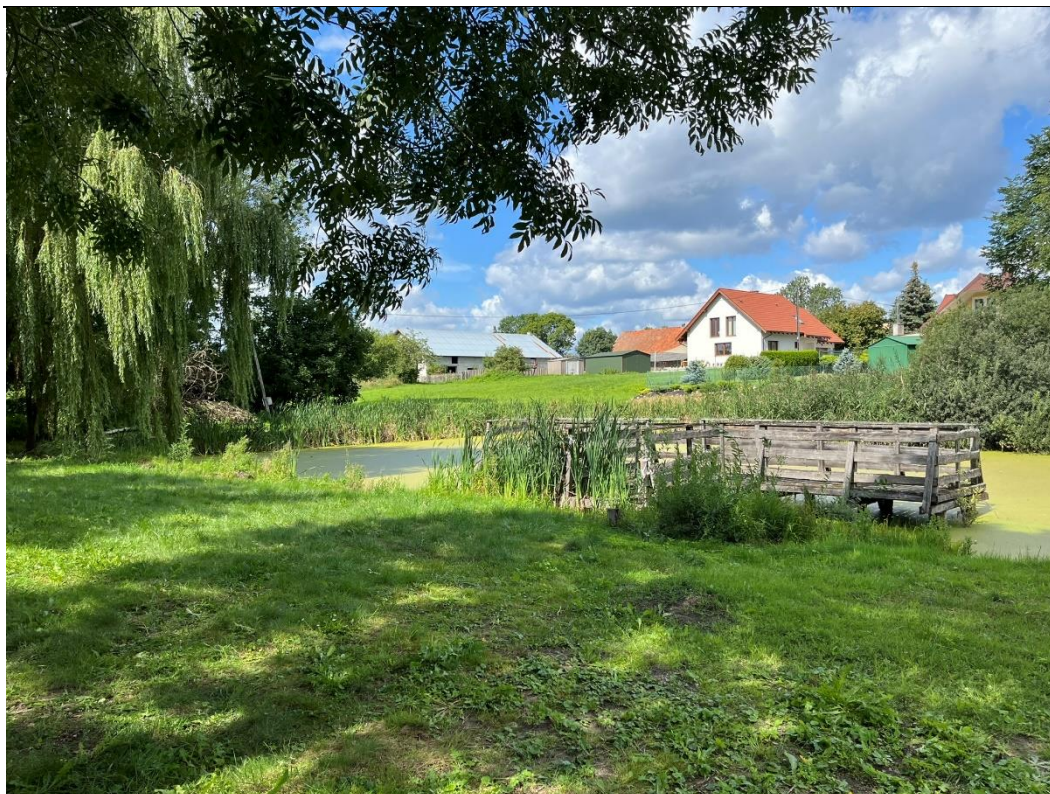
Fot.2. Zbiornik wodny będący obszarem badań.