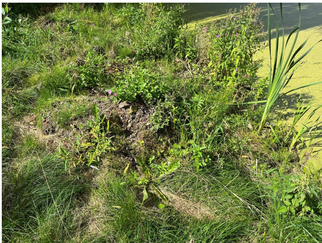
Fot.3. Resztki gruzu na południowym brzegu stawu.